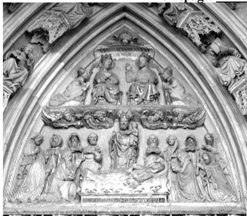
Tympanon des Eichstätter Domportals

Anschrift: Pfarrverband: Hauptstraße 21, 82433 Bad Kohlgrub Tel: 08845/703040 Fax: 08845/703044 Öffnungszeiten des Pfarrbüro: Bad Kohlgrub-St.Martin: Di.:08:00-12:00 Mi.:14:00-17:00 Fr.:08:00-11:30 Uhr Bad Bayersoien-St.Georg: Do, 09:00-10:00 Uhr Altenau-St.Antonius: Fr, 09:00-10:00 Uhr eMail: PV-Bad-Kohlgrub@ebmuc.de , Anschrift: Pfarrverband: Hauptstraße 1, 82433 Bad Kohlgrub, Homepage: www.pfarrverband-bad-kohlgrub.de